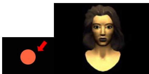
Iluminação superior. Posicionar a luz sob o motivo resulta em um iluminação favorável em cenários comuns. É a luz clássica.